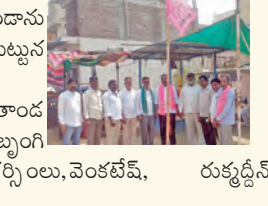
కుల్చర్లపల్లిలో పార్టీ జెండాను ఆవిష్కరించారు.