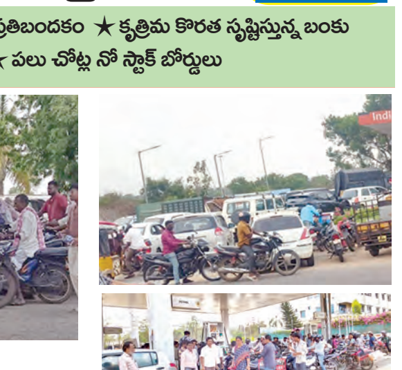
రద్దీ పెగగటంతో సమీకృతిస్తున్న అధికారులు

వాడనగర్/కేంపేలు, ఏప్రిల్ 27, ప్రభాతవార్త : రంగారెడ్డి జిల్లా వాడనగర్ పట్టణంలో గత రెండు రోజులుగా పెట్రోల్, డీజిల్ కొరత తీవ్రమైన దాల్చింది. ఒకప్పుడు ప్రభుత్వ అధికారులు, ప్రజా ప్రతినిధులు ఇందన కొరత లేదని ప్రకటిస్తున్నప్పటికీ, క్షేత్రస్థాయిలో పరిస్థితి అందుకు భిన్నంగా ఉంది. పట్టణంలోని అనేక బంకుల వద్ద నో స్టాక్ బోర్డులు దర్శనమిస్తుండటంతో వాహనదారులు తీవ్ర ఆందోళనకు గురవుతున్నారు. ప్రస్తుతం పెట్రోల్ సీజన్ కావడంతో రాజకీయాల పెరిగింది, కానీ పెట్రోల్ లభించక అనేక శుభకార్యాలకు ఆటంకం కలుగుతోంది. పెట్రోల్ కోసం వాహనదారులు కిలోమీటర్ల మేర క్యూ కడుతున్నారు. అన్నారం బైపాస్ దగ్గర ఉన్న ఒక బంకులో వాహనాలు బారులు తీరడంతో, పరిస్థితిని అదుపు చేయడానికి పోలీసులు పహారా కానుక అందన సరఫరాను వర్తమాన్యం చేస్తున్నారు. మరోవైపు, కొందరు బంకు యజమానులు కృత్రిమ కొరతను సృష్టించి బ్లాక్ మార్కెట్లో అధిక ధరలకు విక్రయించాలని వాహనదారులను అణగారినట్లు ప్రజలతోడు ఈ ఇందన కష్టాలు తోడవడంతో సామాన్యులు ఘనరద్దరించాలని ప్రజలు డిమాండ్ చేస్తున్నారు. కేంపేలు మండల కేంద్రం.. మళ్లీ పెట్రోల్, డీజిల్ కొరత తీవ్రంగా కనిపిస్తోంది.