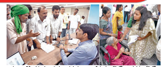
ప్రజావాణికి వచ్చిన బాధితుల సమస్యలు అలకొన్న కలెక్టర్, అదనపు కలెక్టర్

సందర్భంగా అదనపు కలెక్టర్ మాట్లాడుతూ, కృత్రిమ కొరత సృష్టించకుండా ఉండేందుకు డిల్లవు తగిన జాగ్రత్తలు తీసుకోవాలని ఆదేశించారు. ప్రధానంగా కొద్దిమంది వినియోగదారులకు అధిక మొత్తంలో ఇందనాన్ని విక్రయించకూడదని సూచించారు. ప్రజలు తమ రోజువారీ అవసరాలకు మించి ఇందనాన్ని నిల్వ చేసుకోవడం ప్రమాదకరమని, అలాంటి చర్యలకు దూరంగా ఉండాలని హెచ్చరించారు. అదోపాలు సమస్య పెట్రోల్, డీజిల్ సరఫరా నిరంతరం కొనసాగు తుండని, ప్రజలు భయందోహితో ఒకేసారి బంకులకు రావడం కొరకు నియంత్రిత అమ్మకాలు: సరఫరాను క్రమబద్ధీకరించేందుకు అవసరమైన మేరకే విక్రయాలు జరపాలని అయిల్ కంపెనీలను ఆదేశించారు. క్షేత్రస్థాయి వర్తమాన్యం పౌరసరఫరాల శాఖ అధికారులు నిరంతరం బంకులను వర్తమాన్యం చేస్తున్నారు. పరిస్థితి త్వరలోనే సాధారణ స్థితికి వస్తుందని తెలిపారు. ఈ సమస్యలో పౌరసరఫరాల శాఖ అధికారి పనజాతో పాటు ఇతర శాఖల అధికారులు, అయిల్ కంపెనీల సెల్ఫ్ ఆఫీసర్లు పాల్గొన్నారు. జిల్లా యంత్రాంగం తీసుకుంటున్న చర్యలకు ప్రజలు సహకారించాలని అధికారులు విజ్ఞప్తి చేశారు.