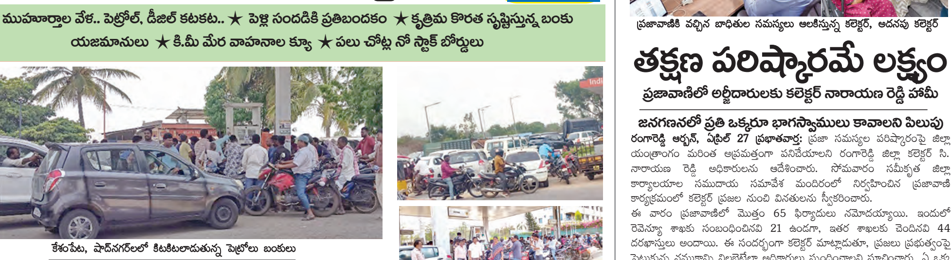
కేంపేలు, వాడనగర్లో కిలకటలుతున్న పెట్రోలు బంకులు

వాడనగర్/కేంపేలు, ఏప్రిల్ 27, ప్రభాతవార్త : రంగారెడ్డి జిల్లా వాడనగర్ పట్టణంలో గత రెండు రోజులుగా పెట్రోల్, డీజిల్ కొరత తీవ్రమైన దాల్చింది. ఒకప్పుడు ప్రభుత్వ అధికారులు, ప్రజా ప్రతినిధులు ఇందన కొరత లేదని ప్రకటిస్తున్నప్పటికీ, క్షేత్రస్థాయిలో పరిస్థితి అందుకు భిన్నంగా ఉంది. పట్టణంలోని అనేక బంకుల వద్ద నో స్టాక్ బోర్డులు దర్శనమిస్తుండటంతో వాహనదారులు తీవ్ర ఆందోళనకు గురవుతున్నారు. ప్రస్తుతం పెట్రోల్ సీజన్ కావడంతో రాజకీయాల పెరిగింది, కానీ పెట్రోల్ లభించక అనేక శుభకార్యాలకు ఆటంకం కలుగుతోంది. పెట్రోల్ కోసం వాహనదారులు కిలోమీటర్ల మేర క్యూ కడుతున్నారు. అన్నారం బైపాస్ దగ్గర ఉన్న ఒక బంకులో వాహనాలు బారులు తీరడంతో, పరిస్థితిని అదుపు చేయడానికి పోలీసులు పహారా కానుక అందన సరఫరాను వర్తమాన్యం చేస్తున్నారు. మరోవైపు, కొందరు బంకు యజమానులు కృత్రిమ కొరతను సృష్టించి బ్లాక్ మార్కెట్లో అధిక ధరలకు విక్రయించాలని వాహనదారులను అణగారినట్లు ప్రజలతోడు ఈ ఇందన కష్టాలు తోడవడంతో సామాన్యులు ఘనరద్దరించాలని ప్రజలు డిమాండ్ చేస్తున్నారు. కేంపేలు మండల కేంద్రం.. మళ్లీ పెట్రోల్, డీజిల్ కొరత తీవ్రంగా కనిపిస్తోంది.