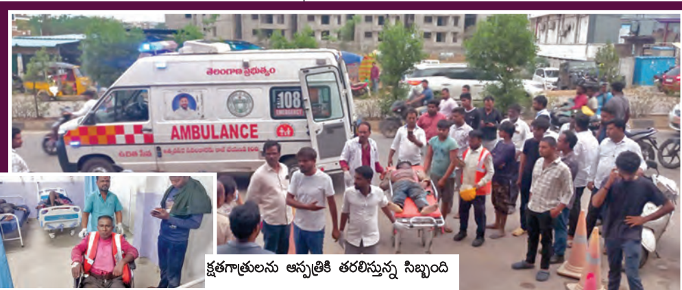
క్షతగాతులను ఆసుపత్రికి తరలిస్తున్న సిబ్బంది

శంకరపల్లి, ఏప్రిల్ 27, ప్రభాతవార్త : రంగారెడ్డి జిల్లా శంకరపల్లి మండలంలో సోమవారం మధ్యాహ్నం ఘోర ప్రమాదం సంభవించింది. ప్రముఖ నిర్మాణ సంస్థ ఎన్.సీ.ఐ. లిమిటెడ్ ప్రాజెక్ట్ పనుల్లో భాగంగా వినియోగిస్తున్న ఒక భారీ క్రేన్ ఒక్కసారిగా