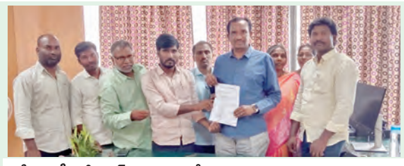
జాతీయ ఎస్సీ కమిషనరు కి ఫిర్యాదు చేస్తున్న ఎట్టపర్తి గ్రామస్థులు